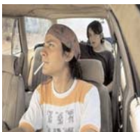
Maribel, Gael y Diego: alegría para la vista.

Antes de que Alejandro Cuarón nos ofreciera la tercera parte de las aventuras de Harry Potter, este director mexicano había dirigido una película totalmente diferente. Y TU MAMA TAMBIEN es una intensa road-movie, protagonizada por nuestra Maribel Verdú y los mocetones mexicanos Gael García Bernal y Diego Luna. Hay varias películas en Y TU MAMA TAMBIEN. La película nos habla de las aventuras de Tenoch y Julio, mientras atraviesan el país con Luisa, una mujer algo mayor que ellos, en busca de una playa soñada. Pero también nos habla de los significados ocultos de la amistad, de